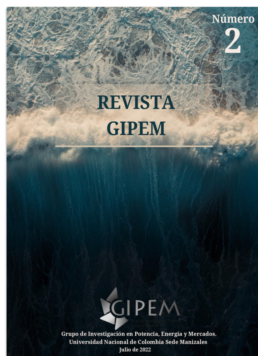
Revista GIPEM N° 2