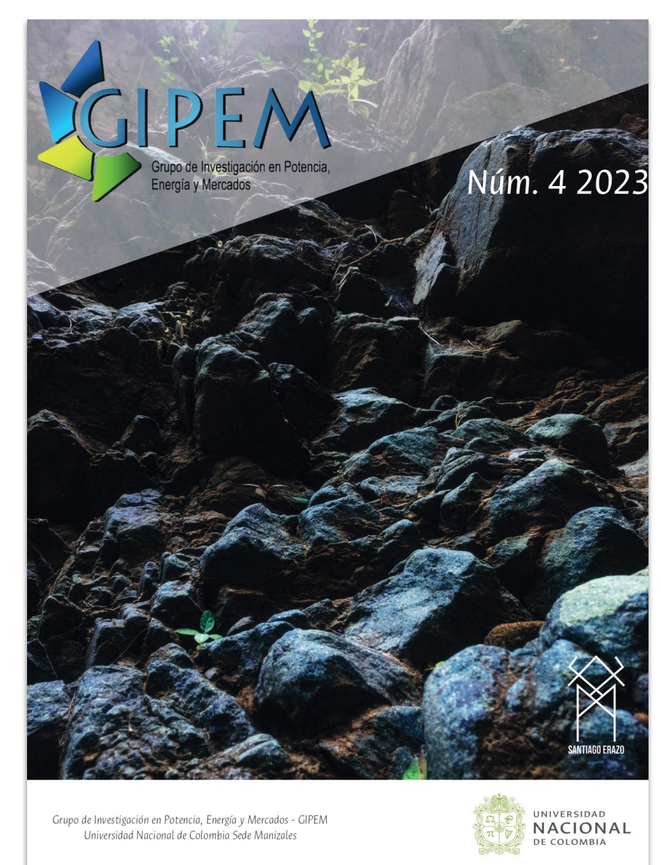
Revista GIPEM N° 4