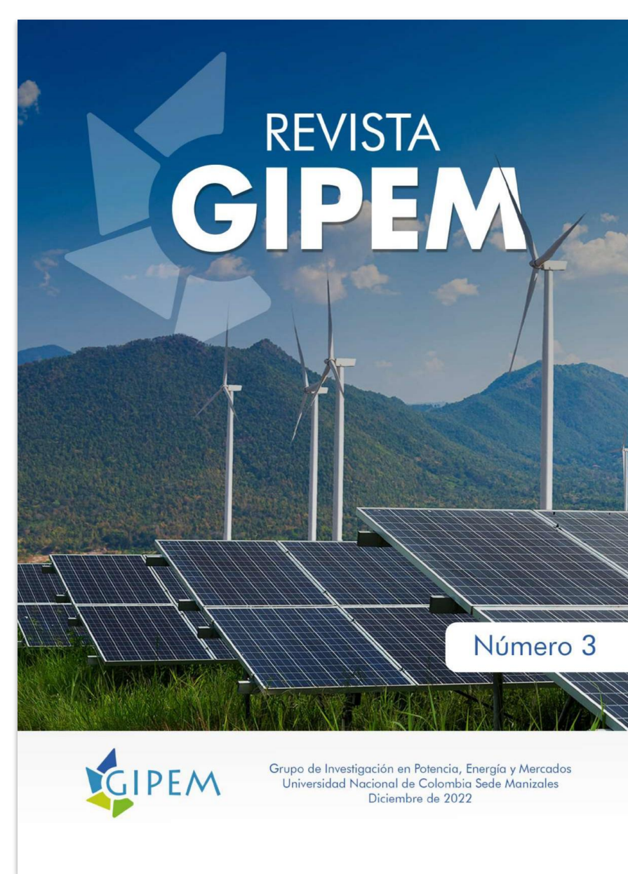
Revista GIPEM N° 3