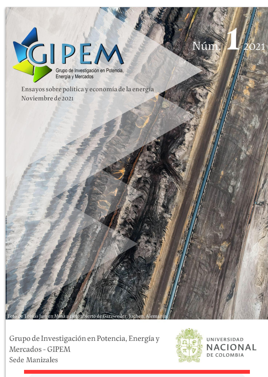
Revista GIPEM N° 1

Posteriormente, el equipo de edición se encarga de realizar un proceso de correcciones y realimentación. Al finalizar este proceso, se comienza con la diagramación, la cual también es realizada por el equipo editorial. Cuando se recopila toda la información, se hacen las respectivas correcciones de estilo de la Revista para, finalmente, publicarla en la página electrónica y ser difundida por los canales del GIPEM.